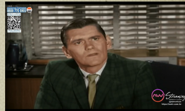
Exemplo de Programática Programa: "A Feiticeira!"

AWTV Streaming - "A sua marca como patrocinadora da "Feiticeira"!!!!"